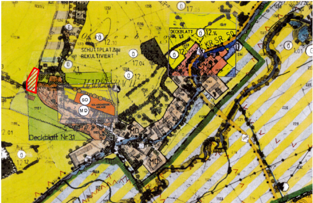
Ausschnitt aus dem Flächennutzungs- mit Landschaftsplan