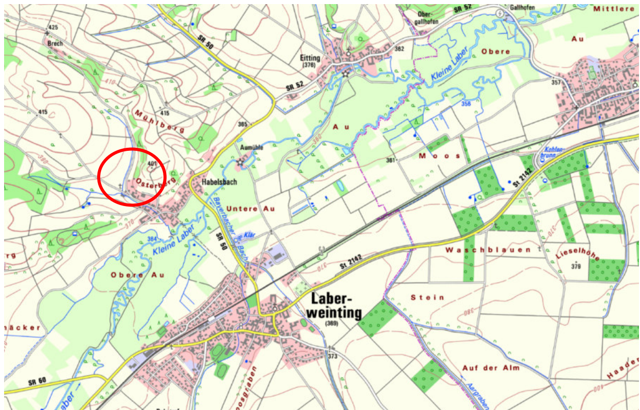
Übersichtslageplan – ohne Maßstab

Die Voraussetzungen des § 34 Abs. 5 Satz 1 Nr. 1-3 BauGB sind auch für das vorliegende Deckblatt zur Satzung erfüllt (Vereinbarkeit mit einer geordneten städtebaulichen Entwicklung, keine erforderliche Umweltverträglichkeitsprüfung, keine Beeinträchtigung von Schutzgütern gem. § 1 Abs. 6 Nr. 7 Buchstabe b BauGB - Erhaltungsziele und Schutzzweck der Natura 2000 - Gebiete im Sinne des Bundesnaturschutzgesetzes).