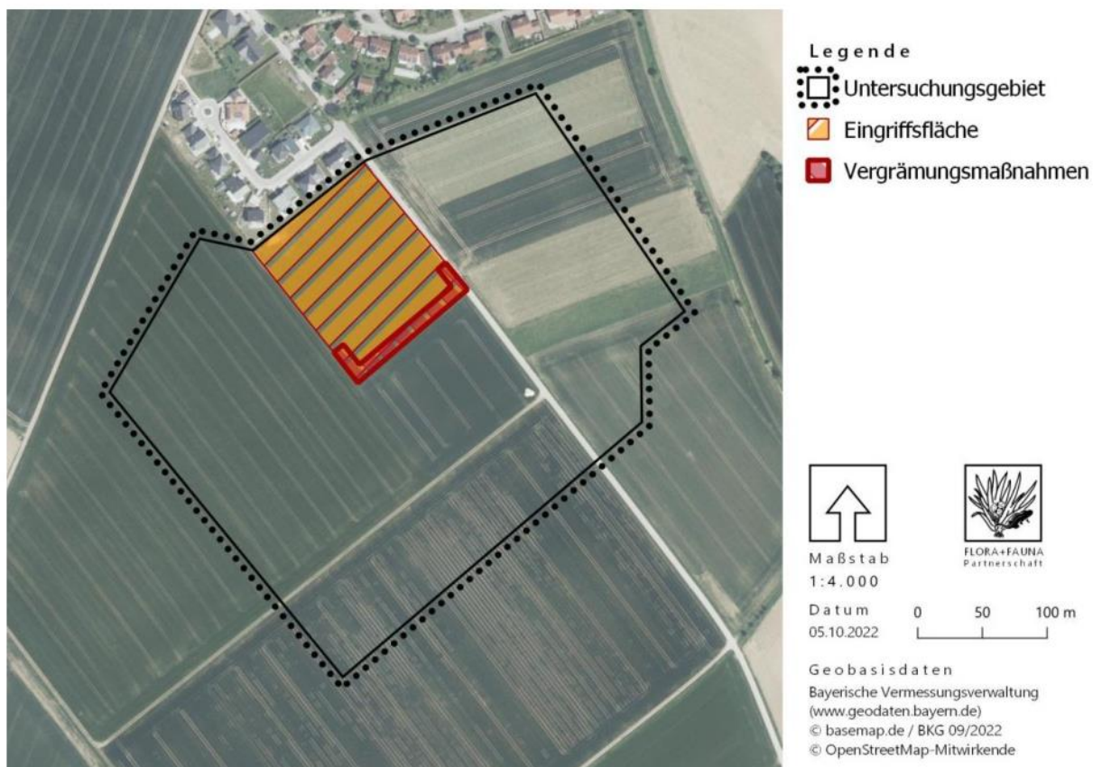
Abbildung 3: Lage der Vergrämungsmaßnahmen

3.5.2 Lage der Vergrämungsmaßnahmen (Auszug aus dem artenschutzrechtlichen Gutachten)