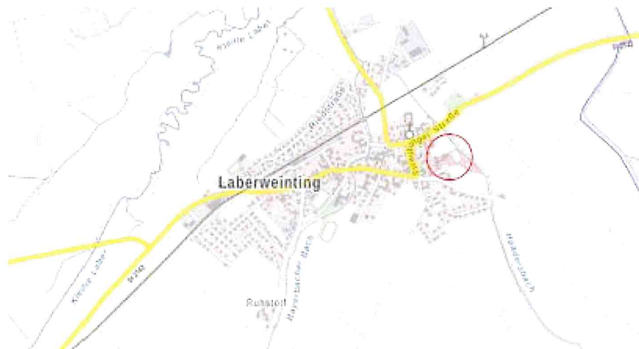
B.-u. G.O.P. MINDERKINDERTAGE / KINDERKRIPE - LABERWEINTING

gem. § 10 BauGB und Art. 81 Abs.2 BayBO als Satzung beschlossen.