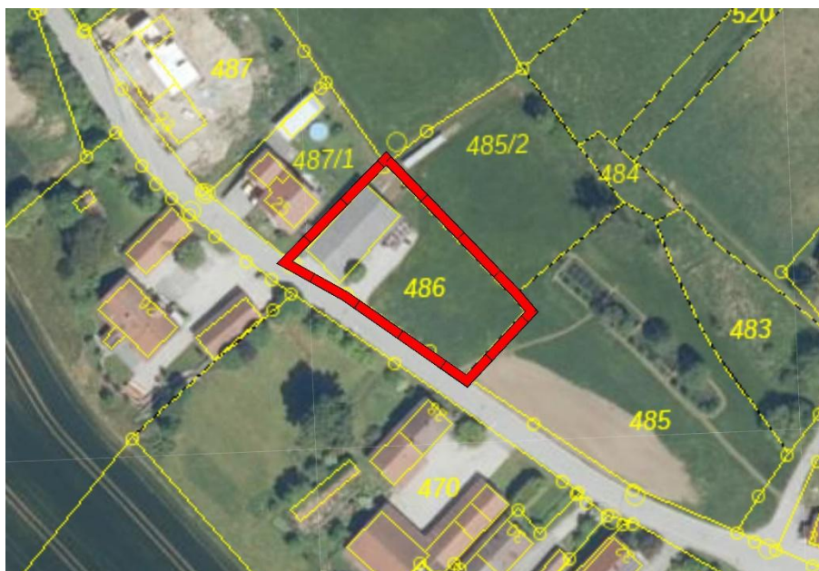
Ausschnitt Luftbild – ohne Maßstab