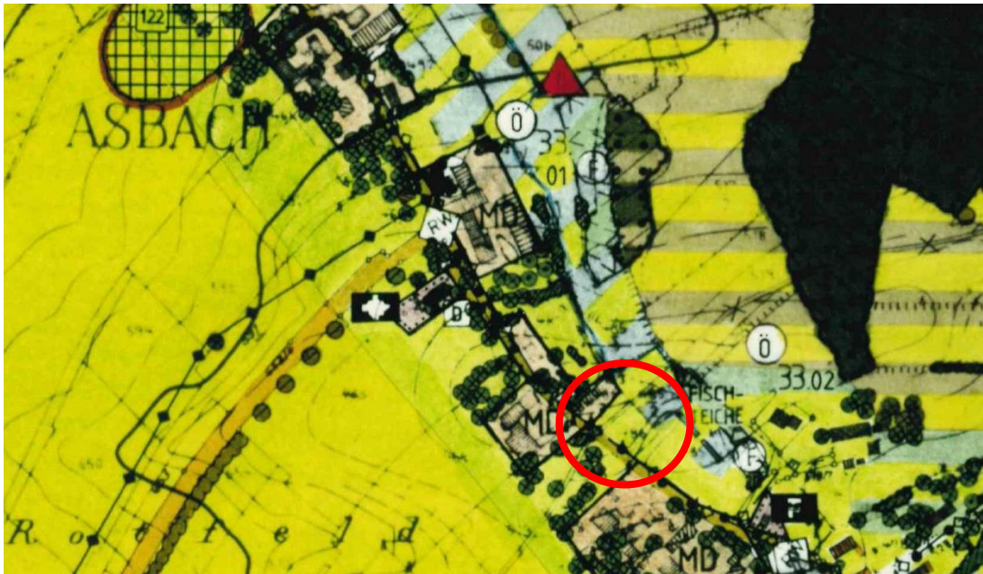
Ausschnitt aus dem Flächennutzungs- mit Landschaftsplan – ohne Maßstab

Im rechtskräftigen Flächennutzungs- und Landschaftsplan (FNP/LP) der Gemeinde Laberweinting wird das geplante Satzungsgebiet größtenteils als Fläche für die Landwirtschaft dargestellt. Im Nordwesten überlagert sich der Geltungsbereich teilweise mit einem Dorfgebiet (MD). Nordöstlich davon schließt ein Talraum der Flüsse und Bäche (hier der Asbach) an.