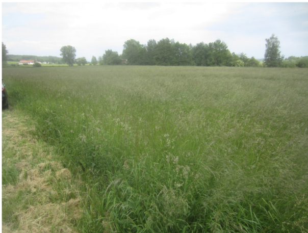
Blick von Nordwesten nach Südosten