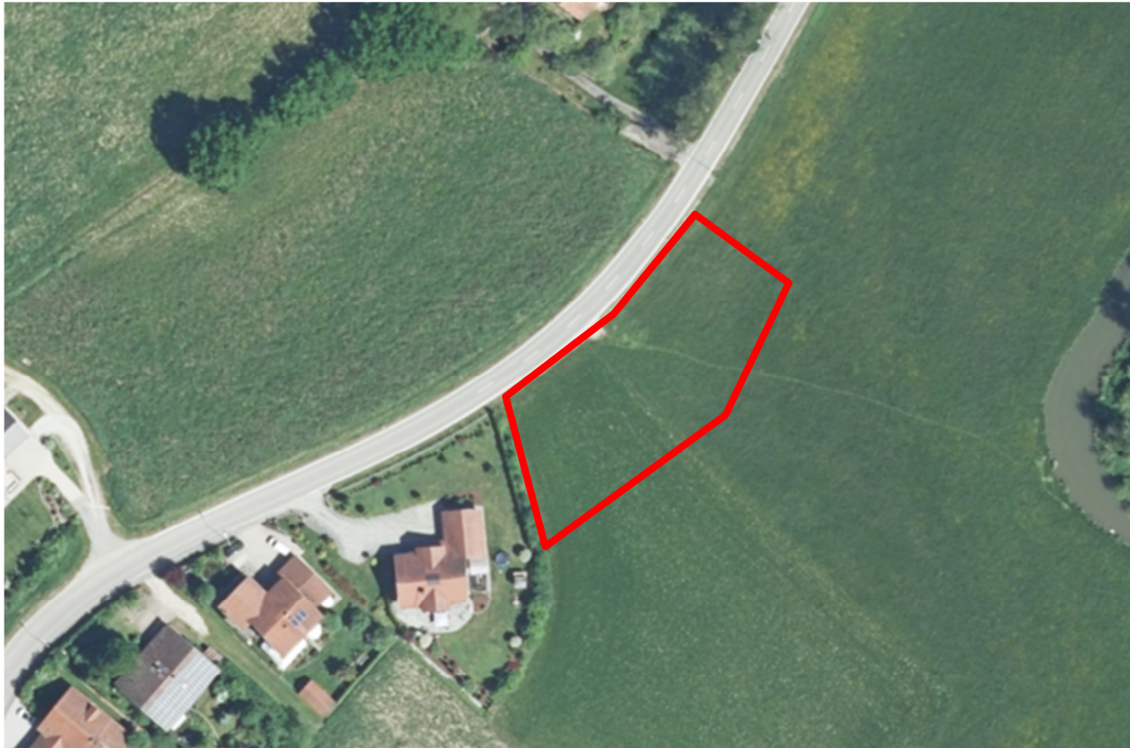
Luftbildausschnitt aus dem Bayern Atlas vom 28.08.2023 – ohne Maßstab