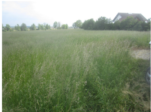
Blick von Nordosten nach Südwesten