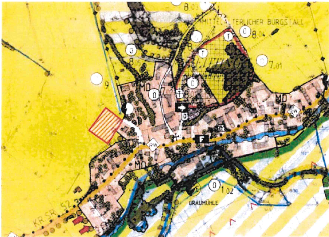
Ausschnitt aus dem Flächennutzungs- mit Landschaftsplan

Der Entwurf des Deckblattes Nr. 1 wird mit Begründung vom 15.07.2021 bis 18.08.2021 während der allgemeinen Öffnungszeiten im Rathaus, Zimmer 02 öffentlich ausgelegt.